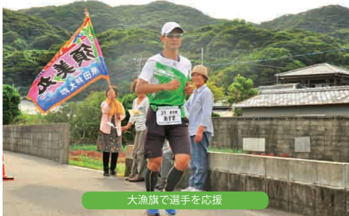
大漁旗で選手を応援