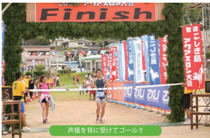
声援を背に受けてゴール!!