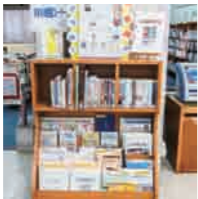
▲おすすめ図書コーナー

中央図書館および各分館では、雑誌を定期的に購入し「雑誌コーナー」に配置しています。中央図書館には週刊誌2誌、月刊誌18誌、寄贈誌2誌の計22誌、各分館には、3誌ずつ配置しています。最新号以外は貸し出しもできませんので、ぜひ、ご利用ください。