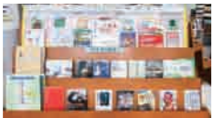
▲新着図書コーナー(一般書)