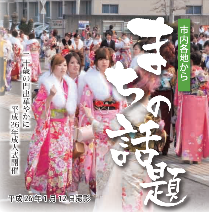
二十歳の門出華やかに 平成26年成人式開催