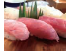
▲甌島の海の幸を満喫してください

2日目 9:00 里武家屋敷跡を散策 9:50 里港発 ▼高速船甌島 10:30 長浜港着、レンタカーで移動 ナポレオン岩やD r.コトー原作の診療所もある瀬々野浦地区を散策 12:00 昼食 13:00 観光(しんきろうの丘～下甌武家屋敷通り～おふくろさん歌碑～郷土資料館～手打海岸～釣掛崎灯台～瀬尾観音三滝) 16:30 長浜港発 ▼高速船甌島 18:00 川内港着 18:10 川内港ターミナル発 ▼川内港シャトルバス 18:35 川内駅着