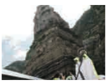
▲観光船かこのから見る断崖・奇岩は感動必至の大迫力!