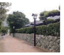
下甌武家屋敷通り

*甌島を初めて訪れる方でも、安心して楽しめる旅行プランもあります。市観光物産協会までお問い合わせください。