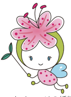
カノユクリの妖精 名前「カノッコ」

花いっぱい市の本市を市内外に広く普及させることを目的として、市内の小中学生を対象にデザイン画を募集しました。応募の中から、花いっぱいまちづくり推進協議会委員の選考により決定しました。 今後、「花いっぱい薩摩川内」の普及活動などに活用していきます。