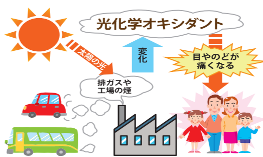
*日差しが強く、気温が高く、風が弱い日に高濃度となりやすい傾向にあります。

▼【申込・問合せ】本庁農政課産業振興G(内線4222)または各支所地域振興課産業振興G(鹿島支所は産業建設G) ▼【光化学オキシダントにご注意を!】 「光化学オキシダント」は、工場や自動車から排出される窒素酸化物などが紫外線により変化したものです。日差しが強くなると、注意報が発令されるときは、防災行政無線やテレビ、ラジオなど注意して聞いてください。 ▼【注意報発令時の注意事項】 ▼屋外での過激な運動を控えてください。 ▼自動車などの使用や外出は控えてください。