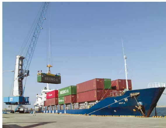
▲40フィートコンテナの荷揚げ作業風景

薩摩川内港と釜山港・上海港・神戸港を結ぶ航路が開設されたことにより、韓国・中国はもとより、台湾・東南アジアや欧米などの遠洋諸港についても物流ルートの開発が可能となりました。