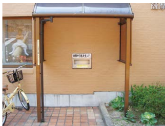
夜間休日返本受入口