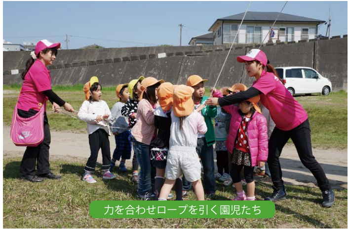
力を合わせロープを引く園児たち

黄色の帽子に大きなランドセル姿で登校する児童らの光景を、毎朝車中からほほえましく眺めます。春は人それぞれに別れと出逢いがあり、新たな挑戦や生活が始動します。わが職場にもピカピカの新社会人が配属となり、元気に笑顔で業務に取り組む姿に親心的な気持ちすら覚えます。「無理しすぎずにキバレ!!」新たな挑戦や生活がスタートした全ての「新1年生」の皆さんに、この紙面からエールを贈ります。(堀之内)