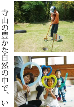
寺山の豊かな自然の中で、

いろいろな体験活動を通し、家族や仲間と一緒に楽しいひとときを過ごしませんか。 【時】2月8日(日) 10時~15時