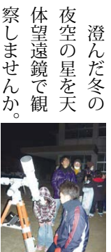
「出張星空観望会」in樋脇