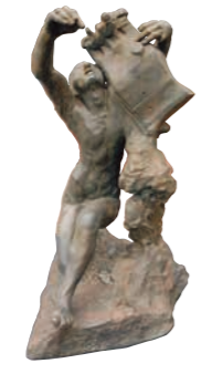
1892年作 ブロンズ像 高さ146cm

国際交流センター正面玄関横には、「考える人」で有名な、巨匠ロダンによる彫刻「オルフェ」が設置されています。これは、ギリシャ神話に登場する竖琴の名手オルフェウスの像で、世界に12体しかない貴重な作品です。