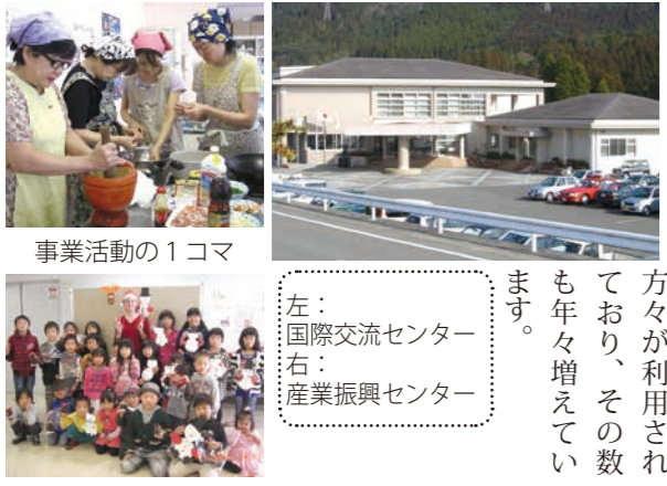
左：国際交流センター 右：産業振興センター

コンベンションホール(392座席)、会議室、研修室、和室、調理室、展示ギャラリーを有し、年間を通して講演会、発表会、コンサート、フォーラム、会議などが開催されています。昨年度は5万3000人を超える方々が利用されており、その数も年々増えています。