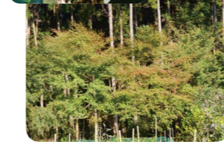
*写真は、11月20日時点のものです。

し、圧巻です。この時季、いろは紅葉の横では、「アサギマダラ」という蝶がひと休みしていました。この蝶は、渡り鳥のように、季節によって長距離を集団で移動する習性を持っているそうです。 (ステゴザウルス・69歳女性)