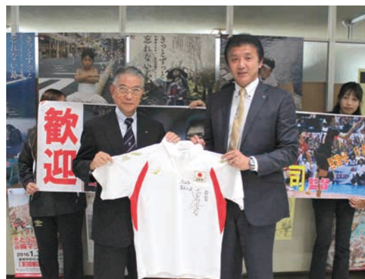
全日本男子・全日本女子