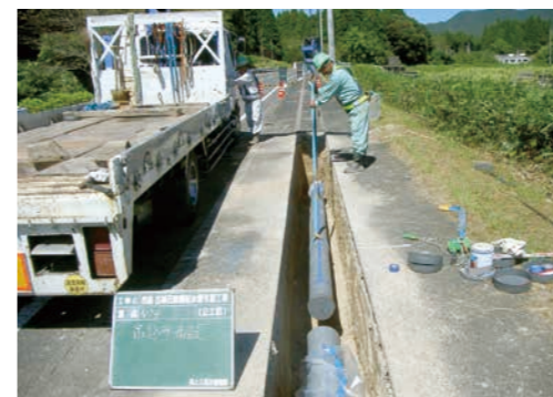
耐震性能のある水道管の布設工事の様子