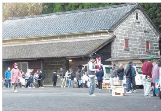
石蔵今昔館・石蔵イベント館へ

全日本男子バレーボールチームの南部正司監督が11月24日(火)、全日本女子バレーボールチームの眞鍋政義監督が12月14日(月)に来庁され、岩切秀雄市長を表敬訪問されました。両監督は、ワールドカップ2015などの結果報告をされました。今後も両チームの活躍が期待されます。