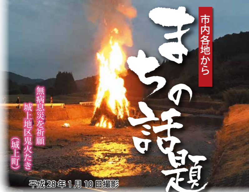
無病息災を祈願 城上地区鬼火たき (城上町)