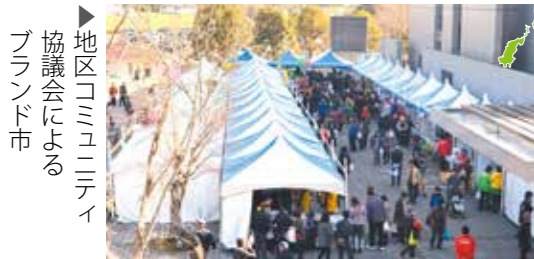
地区コミュニティ協議会によるブランド市