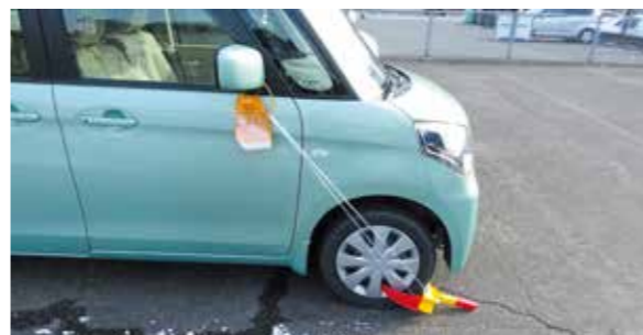
(タイヤロックの実施状況)

●搜索…滞納処分のために必要があると認めた場合、滞納者の住居などに立ち入り、公売可能な財産を捜して差し押さえます。また、自動車の場合は、運行できないようにタイヤをロックすることがあります。