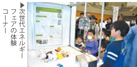
次世代エネルギーフェアの体験コーナー

2月27日(土)・28日(日)、サンアリーナせんだいで生涯学習フェスティバル&次世代エネルギーフェアが開催されました。