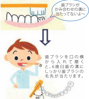
歯ブラシを口の横から入れての溝にしっかりと歯ブラシの毛先が当たります。

生えてくる途中は他の歯より背が低いため、歯ブラシの毛先が届きにくくなります。小さめの歯ブラシで、1本ずつ横から磨きましよう。