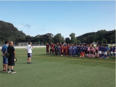
【フットボールデー in川薩】

現在、小学生(女子含む)・中学生・高校生・社会人・シニア・フットサル・キッズの協力