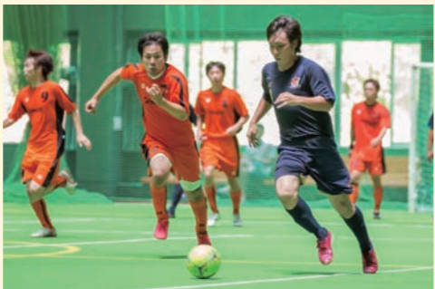
【フットサルリーグ戦の様子】