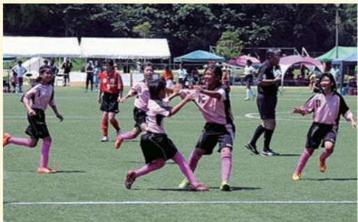
【市比野温泉杯少女大会の様子】