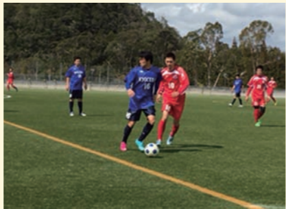
【県サッカー選手権兼天皇杯地域代表決定戦】

当時、県内に協会組織があったのは、県サッカー協会と川内サッカー協会のみで、しばらくの間、二本柱として県内のサッカー競技の普及・発展に尽力しました。この間、薩摩川内市観光大使でもある前園真聖氏ら複数の「Jリーガー」を輩出しました。平成16年10月の合併による薩摩川内市体育協会設立に伴い、新たに薩摩川内市サッカー協会として活動を始めました。