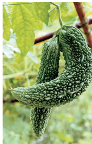
(なかよし 笹原半世)