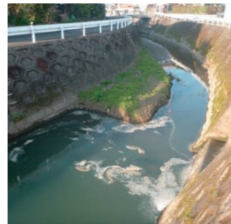
▲春田川に流れ込む生活雑排水