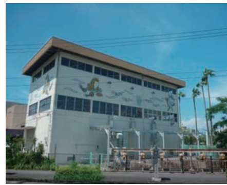
▲向田ポンプ場(川内文化ホール横)

本市では、昭和46年の大水害をきっかけに、市街地の浸水対策に重点的に取り組んできました。現在、向田、中郷、平佐の3ポンプ場が整備されており、水害から市街地の安全を守っています。