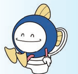
下水道推進マスコットキャラクター「スイスイ」

下水道は、接続することでその効果が発揮される施設です。まだ下水道に接続されていない方は、1日も早い接続をお願いします。地域ぐるみで下水道への接続を促進し、「うるおいのまち」として誇れる素晴らしい環境を、次の世代に残しましょう。