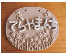
*写真は焼く前の作品

てらやまちの穴窯で焼くオリジナルの「ネームプレート」を作ります。 【時】10月28日(金)9時30分～16時