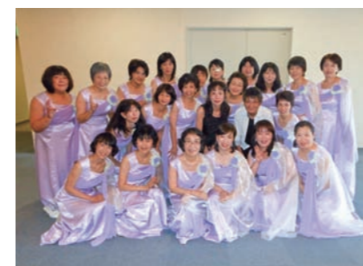
川内女声合唱団 「フローレス・ヴォーチェ」の皆さん

で行われた第39回全日本おかきんコーラス全国大会に出場し、団員22人で心をひとつに演奏してきました。多くの方々の応援のおかげで、ひまわり賞(金賞)をいただくことができました。 18年前、「県外で演奏することがあるかもしれないから」と団名の前に「川内女声合唱団」を添えました。新聞の全国版にその名前が掲載された時に、心から命名してよかったと思いました。 団員一同、今後も感謝の気持ちを、さらに磨いた歌声に乗せて歌い続けていきたいと思えます。イベント、学校や施設の訪問、元氣