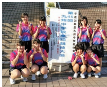
(北中女子卓球部応援ママ)

台風一過の風に、かすかな秋の気配が感じられるようになりました。中学3年生の娘たちは、卓球に明け暮れた部活中心の生活を終え、今は受験勉強にいそしんでいます。今年は、県代表として九州大会に3回、さらには全国大会にも出場し、チーム一丸となって立派な足跡を残してくれました。厳しい練習を乗り越えてきた子どもたちの表情は頼もしく、保護者の一人