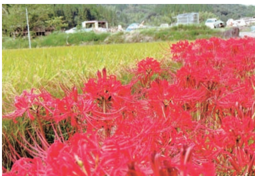
題名「彼岸花」 (写真好き・86歳男性)