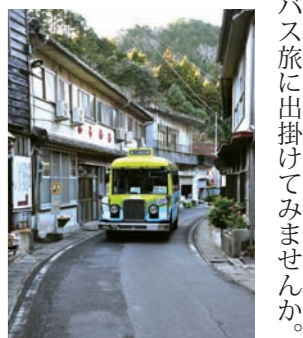
バス旅に出掛けてみませんか。

【勤務場所】 公社管理施設 【応募資格】 健康な方で、普通自動車運転免許を有し、左記の応募条件をいずれも満たす方 【職種】 公園管理 【募集人員】 1人 【雇用期間】 1年以内 ＊再雇用あり 【勤務内容】 公園などの整備、刈払い、樹木の剪定作業、作業員の指導監督など 【応募条件】 ▼公園施設の維持管理、刈払い、樹木の剪定作業ができる方 ▼作業員の指導管理ができる方 【勤務条件】 公社の基準による 【提出書類】 履歴書(市販品)・自筆・顔写真貼付 【試験内容】 作文、面接 ＊書類選考あり 【試験日】 後日、応募者に通知 【応募締切】 1月31日(火)必着 【応募方法】 直接または送付 【応募・問合せ】 〒895・0054 若松町3・10 薩摩川内市民まじづくり公社 総務課(川内文化ホール内) ☎(22)8500 ゆるっとバス旅 レトロなボンネットバスで、