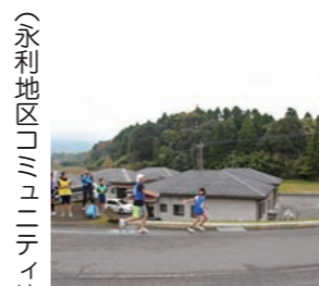
(永利地区コミュニティ協議会)

生まれました。優勝は、終始レースをリードした、Eブロック(ホープタウンヤサンビレッジ)で編成でした。選手編成や走行中の安全確保など、難儀な面も多々ありますが、今後も「続けることに意義がある」をモットーに永利校区の師走の風物詩を守り続けていきます。