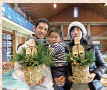
▲新年を迎える手作りのつどい