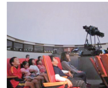
▲ウイークエンドプラネタリウム開放