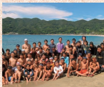
▲夏のアドベンチャー「薩摩川内ぼっけもんの旅」

*利用を希望される際は、直接問い合わせください。 *詳しい内容は、「広報薩摩川内」や小・中学校を通じて案内します。