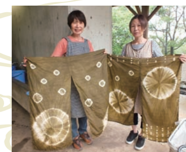
▲てらやまんち森の学校(草木染め)