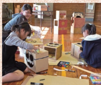
▲てらやまんちオータムフェスタ