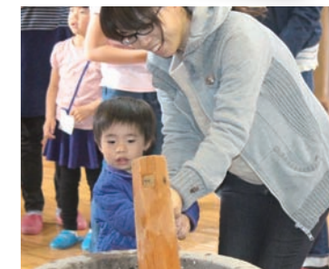
▲ファミリー自然体験隊(春)