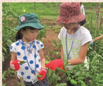
▲ファミリー自然体験隊(夏)