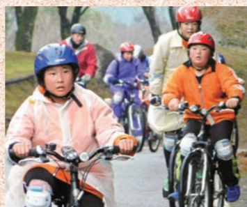
▲冬のアドベンチャー「薩摩川内ぼっけもんの挑戦」