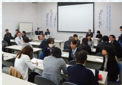
セミナーの最後には、少人数でグループを作り、参加者間での意見発表を実施

参加者からは、「大変な業務の中で、職員が働きやすい環境づくりに積極的に取り組み、年齢や性別、生活スタイルに合わせたシフトや、職員が人間らしく働ける職場にするための工夫を聞くことができた」「自分自身の働き方を考える中で、気付きをもらった」などの感想が寄せられました。事業所を対象としたこのようなセミナーは初めての試みでしたが、今後も継続してセミナーを開催していきます。一人一人の能力を最大限に発揮できる就業環境の整備を目指して参加してみませんか。