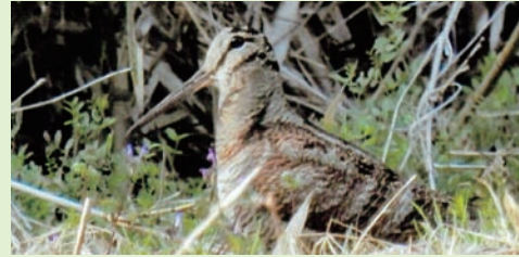
題名「ヤマシギ」(スノーピークの耳・53歳女性)

近所の林にヤマシギの姿を見つけました。近隣の自然が目に見えて減ってきている現在、彼らの安住の地が奪われなければいいのですが…。