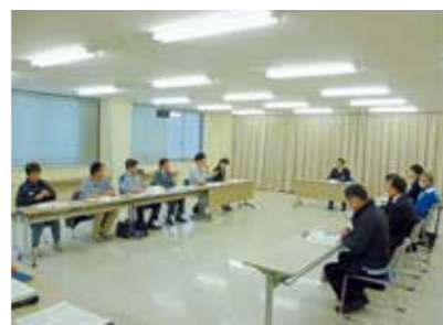
▲地域みまもりネット協力事業所の皆さん

し中でした。不審に思い、ケアマネージャーに連絡し、再度電話確認をしてもらいましたが、同じ状況でした。そこで、一緒に確認に訪れたところ、動けない状態となっていたため、すぐに救急車を呼び、対応をお願いしました。