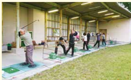
練習会で指導を行う当協会員