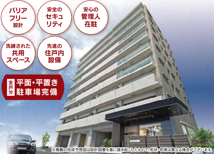
※掲載の完成予想図は設計図書に基づき描き起こしたもので、形状・色等は異なる場合がございます。