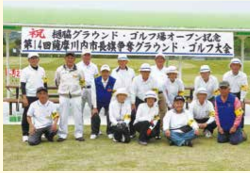
9月11全国グラウンド・ゴルフ交歓大会