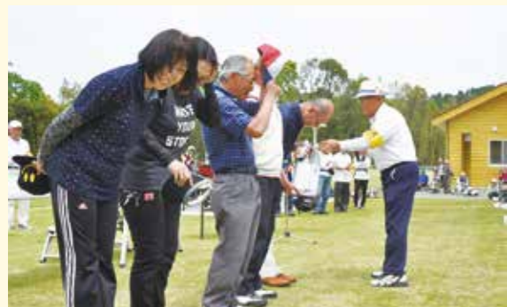
市長旗争奪グラウンド・ゴルフ大会で、下甞地域体育協会に「遠来賞」が授与されました。