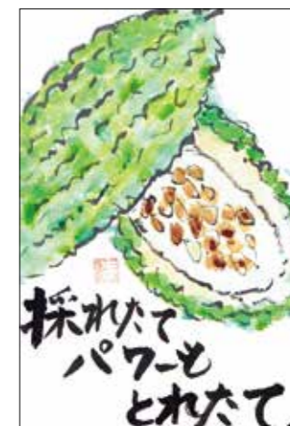
題名「採れたてパワースもとれたて」(まりちゃん・60代女性)

8月号に掲載された方から、プロ野球・巨人の杉内俊哉選手のサイン入り色紙を1名にプレゼント。その他、掲載された方には、竹ノート(A5版)を贈ります(当選の発表は、発送をもって代えさせていただきます)。