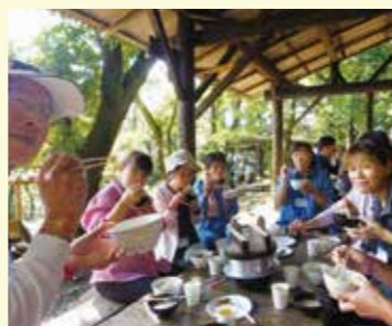
▲元気はつらつスクール