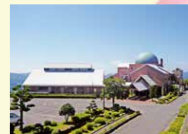
▲少年自然の家「てらやまんち」