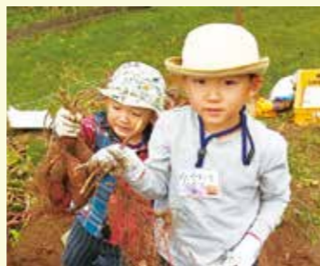
▲ファミリー自然体験隊(秋)