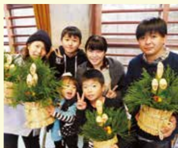
▲新年を迎える手作りの集い