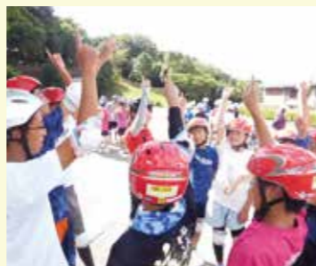
▲夏のアドベンチャー「薩摩川内ぼっけもんの旅」