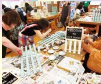
▲てらやまんち森の学校(木工)