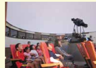
▲プラネタリウム室