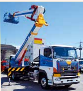
▲最大地上高40mの高所作業車

レーンから550トンの大型クレーンまで、全部で121台を所有し、各種工事に対応しています。近年では特に大型クレーンや高所作業車の拡充に力を入れており、平成22年には、最大地上高40mの高所作業車を導入し、通常の高所作業車では届かない超高所での作業に対応しています。また、今年九州最大級となる54mの高所作業車を導入予定であり、さらなる高所での作業が可能になると期待しています。この他、九州新幹線開通工事や駅ビル建設といった大規模プロジェクトにも参加し、本市をはじめ、全国で顧客のニーズに対応しています。