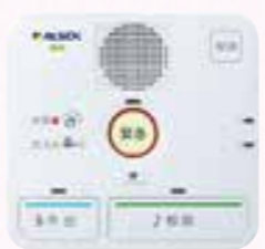
▲操作の簡単なコントローラー

生)家の中にコントローラーを設置して、ボタン一つで緊急時に駆け付けたり、普段から相談を受け付けたりするサービスです。他にも、「みまもりタグ」といって、靴に付けておけば電波を発して、位置情報の把握ができるという商品もあります。