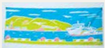
▲里港ターミナルがモチーフの「ウミネコたちとごきげんフェリーの三色てぬぐい」1,620円です。