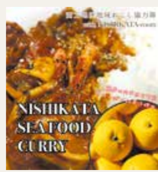
NISHIKATA SEAFOOD CURRY

現在はメニューにありませんが、いつかどこかで見掛けたら、ぜひ一度食べてみてください。