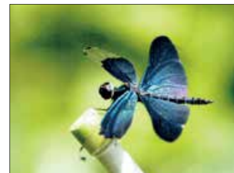
題名「チョウトンボ」 (笹原はんじら・82歳男性)