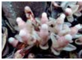
(下甑島の山親父・70歳)

この2種類の植物は、絶滅危惧種I類に指定されています。このような甑島の宝を大切にしていきたいものです。 また、植物だけでなく、絶景ポイントもたくさんあります。私は山歩きが趣味で、山の植物の観察や山道整備のボランティアなどをしていきます。 皆さんも、ぜひ下甑島の植物や絶景ポイントを楽しんでみてください。