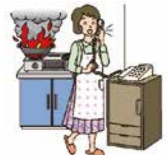
③揚げ物をするときは、その場を離れない