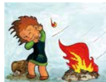
④風が強いときは、たき火をしない