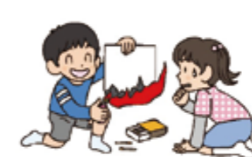
⑤子どもにはマッチやライターで遊ばせない