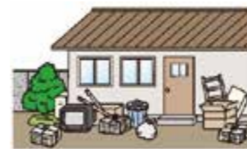
①家の周りに燃えやすい物を置かない