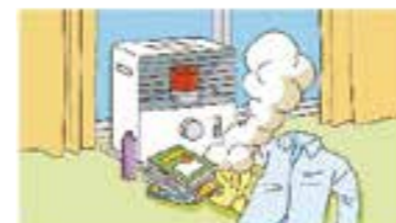
⑥ストーブに燃えやすい物を近づけない