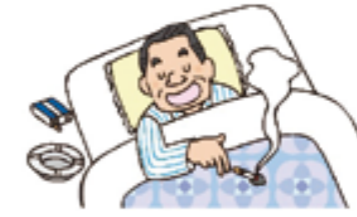
②寝たばこやたばこの投げ捨てをしない