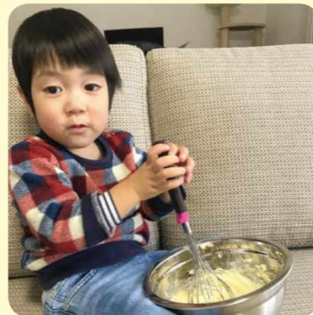
お手伝いをしてくれてありがとう。(そうちゃんママ)