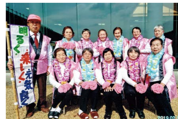
題名「良き仲間にもまれて、明るく楽しく元気よく活動しています」(原フレンド会)