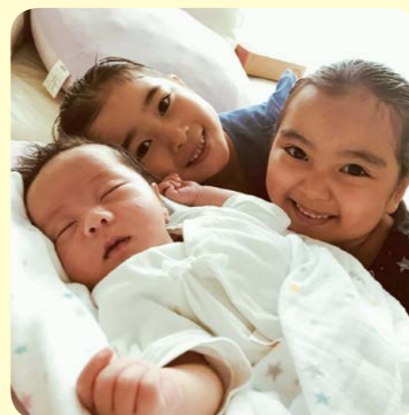
とっても頼りになるお姉ちゃんたちです。(tomo)

【提出・問合せ】=本庁ひとみらい政策課(内線4741) ☎ hitomirai@city.satsumasendai.lg.jp