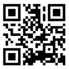
川内能力開発協会 川内技術開発センター ホームページ

▼演習編 9月14・21・28日 *各土曜日9時～16時 【所】川内能力開発協会川内技術開発センター(青山町) 【対象】電気事業者、新卒資格希望者、建築関係者、電気工事について学びたい方など 【定員】各講座10人程度 *申込状況により中止する場合があります。 【受講料】①②の各編1万3000円 *教材、模擬テスト代などを含む 【申込締切】各講座開催日10日前 【申込方法】直接、電話または住所・氏名・連絡先を明記の上、フアクス *申込書はホームページ上からダウンロードできます。 【申込・問合せ】川内能力開発協会川内技術開発センター(青山町) (22)3873 (20)6423