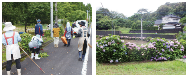
▲環境美化活動で剪定から追肥まで丹精込めて育てたアジサイです。今年も「あじさいロードを歩こう会」が開催されました。

245会は高齢化・過疎化が進む西川内集落で、ゴールド集落支援市民活動補助金を活用して、高齢者が憩える場所と環境づくりに取り組んでいます。また、取り組みを県内外に発信し、地元への愛着心を伝えたいと活動しています。