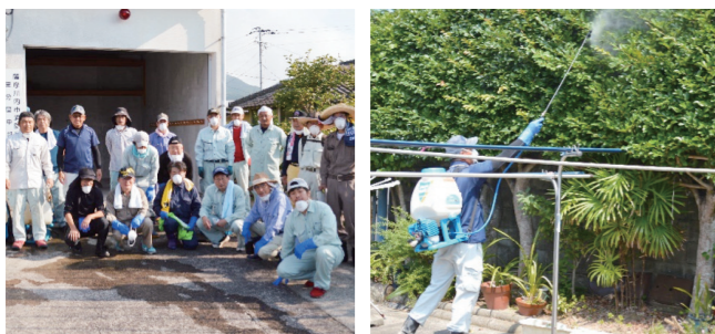
▲作業開始前と薬剤散布作業中の写真です。ゴールド集落を支える頼もしい仲間です。

里地区の菌上自治会ではゴールド集落自主活動支援補助金を活用して、集落内の防除事業を実施しています。集落では空き家、空き地などが多くなってきており、地域住民が快適に過ごせる環境整備に取り組んでいます。