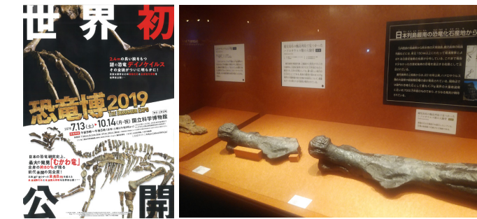
▲国立科学博物館(東京都)

7月13日(土)から、東京都、熊本・鹿児島県の3カ所で甌島の恐竜などの化石が紹介されています。東京都の国立科学博物館では、「恐竜博2019」として、熊本県の御船町恐竜博物館では、「肉食恐竜