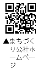
▲まちづくり公社ホームページ

*詳しくは募集要綱、薩摩川内市民まちづくり公社ホームページをご覧ください。 *詳細な練習などの日程は、出演が決めた後にお知らせします。 *出演料や旅費などの支給はありません。 内容／歌唱・ダンス・演技の審査 *動きやすい服装で参加ください。