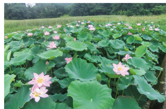
題名「ハスが見頃を迎えました(8月撮影)」(尾白江自治会)

近藤農園(水引町6290) ☎(26)2778 その他、掲載された方には、竹ノート(A5版)をプレゼントします。