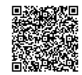
▲鹿児島県ホームページ

詳細は、市ホームページをご覧ください。 時／10月29日(火)13時30分 所／川内文化ホール 対象者／本事業に関心がある方 建設・不動産事業者など 問い合わせ先 本庁建築住宅課建築G(☎3635)