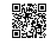
▲れいめい中学校ホームページ

申込締切／ ▼第1回 10月21日(月) ▼第2回 11月11日(月) 申込方法／電話、ファクス、電子メール、ホームページ上の参加申込フォーム 問い合わせ先 中学校 ☎(23)8801 ☎(23)8858 ✉reimei-chu@po12.synapse.jp