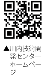
川内技術開発センターホームページ

受講料／3万円(テキスト代含む) 申込締切／12月18日(水) 申込方法／直接、電話または川内技術開発センターホームページ上にある申込用紙に必要事項を明記の上、ファクス 川内技術開発センター (22)3873 (20)6423 実施期間／11月18日(月)～24日(日) *平日は、8時30分～19時 *土・日曜日は、10時～17時 内容／女性をめぐるさまざまな人権問題を解決するため、全国一斉に「女性の人権ホットライン」強化週間を実施します。 *相談内容は問いません。相談には、法務局職員または人権擁護委員が応じ、秘密は固く守られます。 相談受付／ (0570)070810 *1P電話からは接続不可 鹿児島地方法務局人権擁護課 (099)2590684 *申込状況により中止する場合があります。