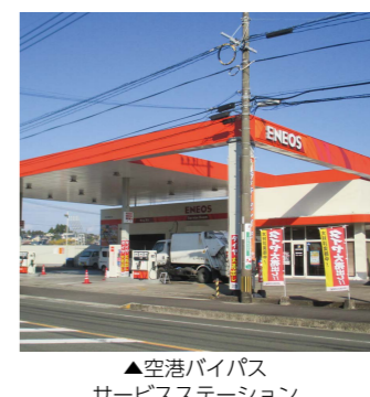
▲空港バイパス サービスステーション

災害に備えた取り組み 本社には、国の認定を受けた「災害認定油槽所」があり、軽油20kL、重油10kLを備蓄しています。災害発生時には、タンクローリーで病院や避難所へ優先的に燃料を供給します。熊本地震後も現地に燃料を運び、約2週間の災害支援に従事しました。 地域に根差した取り組み エネルギーに携わる会社と