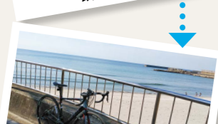
西方まで来ちゃいました