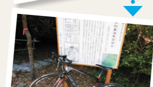
文化財も押さえつつ