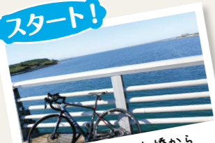
川内川河口大橋から