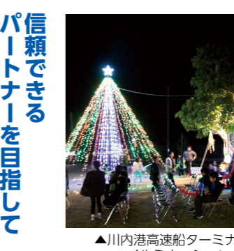
▲川内港高速船ターミナルのイルミネーション

信頼できるパートナーを目指して 当社の使命は、暮らしを支えるエネルギーを安全かつ安定的に供給することです。そのため、これからも技術やノウハウだけではなく、「信頼できるパートナー」を目指していきます。 荒木商事株式会社 隈之城町280番地3 ☎(25) 2191