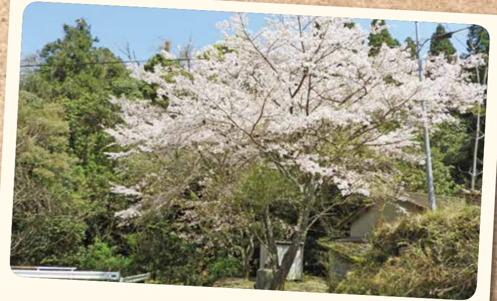
津田集落跡(東郷町)