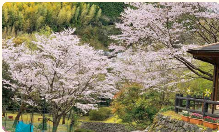
矢立農村公園(祁答院町)