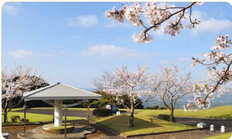
愛宕ビスタパーク(入来町)