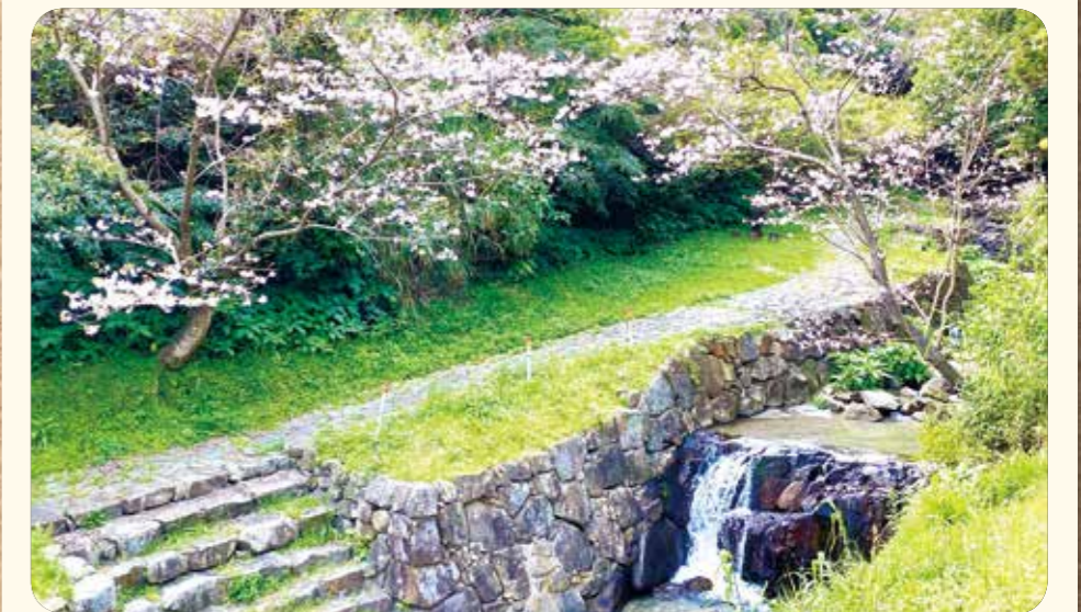
瀬尾観音三滝キャンプ場(下甑町)

いかがでしたか。市内にはまだまだ紹介しきれないほどの桜スポットがあります。新型コロナウイルス感染症の影響が一日も早く終息して、来年の春にはきつとすてきなお花見ができることを僕は祈っています。