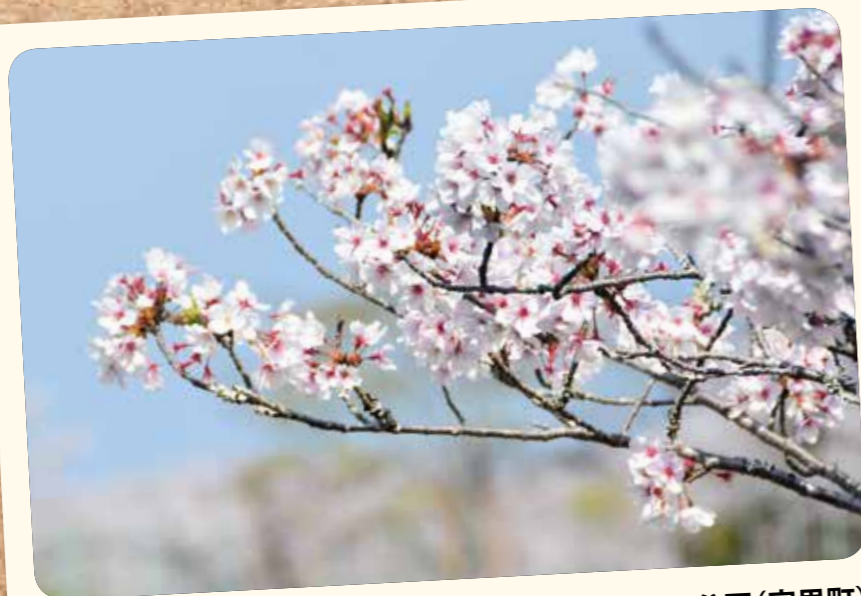
清水ヶ岡公園(宮里町)

いかがでしたか。市内にはまだまだ紹介しきれないほどの桜スポットがあります。新型コロナウイルス感染症の影響が一日も早く終息して、来年の春にはきつとすてきなお花見ができることを僕は祈っています。