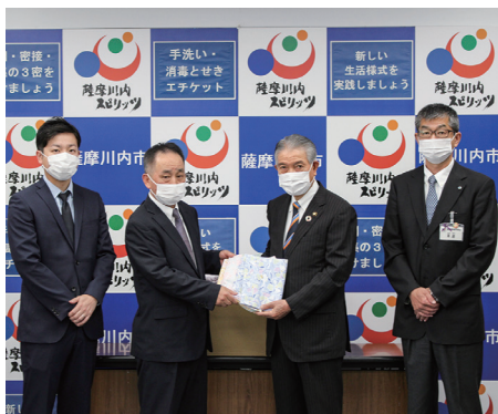
▲株式会社エイティー今藤