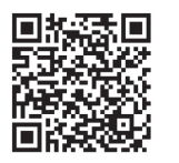
▲市次世代エネルギーウェブサイト

「高速船甑島」の運休と「フェリーニューこしき」の長浜港での車両乗降制限 利用される方は、ご注意ください。