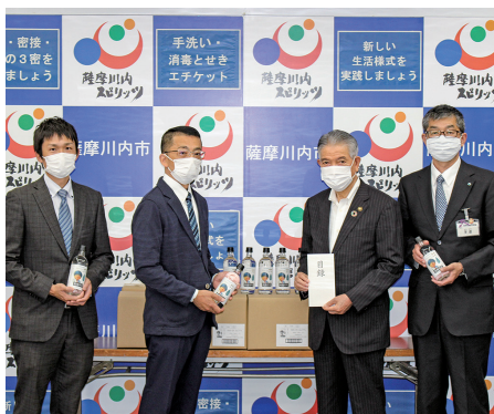
▲田苑酒造株式会社

「まちの話題」は、市民の皆さんから情報提供をいただき、身近な話題を掲載しています。ぜひ投稿ください。