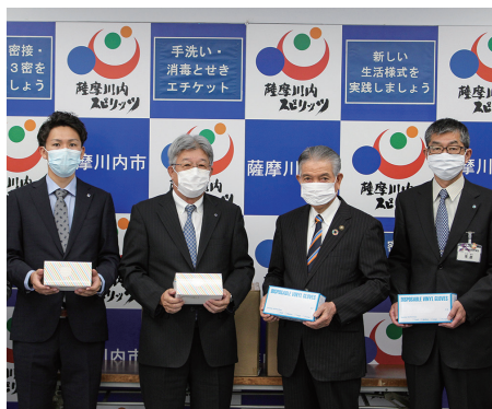
▲田中石油ガス株式会社

今藤からガーゼ、田苑酒造(株)から消毒用高濃度エタノールなどを寄贈いただきました。