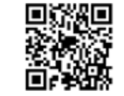
▲プレミアム付商品券特設ページ(薩摩川内観光物産ガイドこころHP内)

許証などの身分証明、印鑑（スタンプ印不可）をお持ちの上、郵便局や各会場で購入 *商品券は、1世帯につき1セット1万円分の商品券を5000円で販売します。 *代理人が購入する場合は、購入引換券、代理人の身分証明および印鑑が必要です。 本庁プレミアム付商品券事業プロジェクトチーム ☎(23)5010