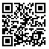
▲川内職業能力開発短期大学 校 HP

川内職業能力開発短期大 学校(ポリテクカレッジ川内)キャンパス見学会 時/8月23日(日)、10月18日(日)各12時30分〜16時 所/川内職業能力開発短期大学(高城町) 内容/学校紹介、入試・就職情報、各科概要、施設見学、ミニ授業など 申込締切/各開催日の前日 申込方法/電話、ファクス、ホームページ上の申込フォーム ④川内職業能力開発短期大学 校 学務援助課 ☎(22)1558 ☎(22)6612