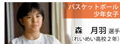
バスケットボール 少年女子

茨城国体でも代表メンバーとして出場したが、今大会に対する思いは特別なものがあつた。前大会で仲間たちと果たせなかった悔しさを、全力でぶつけていく思いでいっぱいだった。リベンジする舞台が無くなり、言葉が出ない。