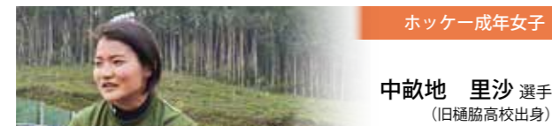
ホッケー成年女子

延 期とか中止については前々から思っていたが、正直残念としか言いようがない。年齢的にも今大会が最後と考えていた。来年の三重国体については今のところは考えていない。 今まで応援してくれた人たちや指導者に心から感謝している。みんなの声援で頑張ろうという気になれたし、自分だけの力では出せなかった結果を指導者が導いてくれた。 思い入れの強い大会は、スナッチ77kg級で2位に入賞した愛媛国体。前大会(右手)で結果を出せていなかったの、この入賞で自信につながり、さらに競技を続ける原動力となった。 これまでの経験が、日ごろの仕事や生活などにも生かしていけると考えている。