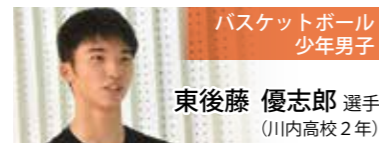
バスケットボール 少年男子

今までインターハイなどに出場してきたが、国体は特別の舞台。地元、薩摩川内でのみんなの期待に応えなかったが残念である。ただ、次の国体も視野には入っており、さらに挑戦し続けたい。今まで共に頑張ってきたチームメイトにも感謝している。