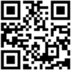
▲川内技術開発センターHP

⑤遺言などに関する相談 ⑥成年後見手続きに関する相談 ⑦裁判手続きや裁判所に提出する書類に関する相談 ⑧消費者金融問題、架空請求問題に関する相談 ⑨供託に関する相談 ☎県司法書士会 099(256)0335