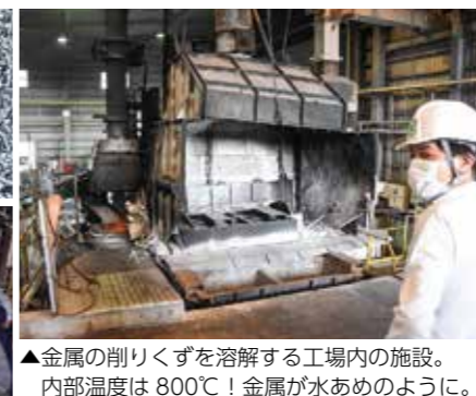
▲金属の削りくずを溶解する工場内の施設。内部温度は800℃！金属が水あめのように。