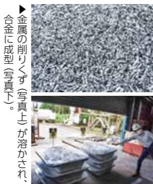
▶金属の削りくず(写真上)が溶かされ合金に成型(写真下)。