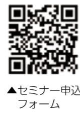
▲セミナー申込フォーム

はこれから就業を目指す女性 *受講無料 託児／6カ月～小学校低学年 *事前申し込みが必要 申込締切／各実施日の14日前 申込方法／電話または住所・氏名・連絡先を明記の上、ファクス、メール ☎(25)4739 ☎(29)4430 ☎(25)4739 本庁ひとみらい政策課ひとみらい政策G(4741) ☎(20)5570 hitomiai@city.satsumasendai.jp ヨガ教室 時／ ▼前期Ⅱ10月9日(金)～12月11日(金)の毎週金曜日19時～20時30分(全10回) ▼後期Ⅱ令和3年1月8日(金)～3月12日(金)の毎週金曜日19時～20時30分(全10回) 所／樋脇保健センター 内容／癒し、体力向上、リフレッシュ、ボディメイクを目的としたヨガ 対象／成人で医師による運動制限のない方 定員／各期先着30人 申込開始／9月17日(木)～ 申込方法／電話 ☎(20)1281 ひまわり友あい館 ☎(20)1281