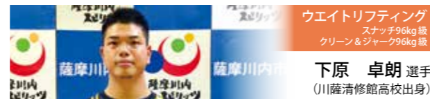
ウェイトリフティング スナッチ96kg 級 クリーン&ジャーク96kg 級

県外で活動していた時期もあったが、かごしま国体の開催に照準を合わせ地元に戻ってきた。今大会が最後という思いで、全力を注ぐつもりであった。3年後の延期案も出ているが、今は想像できない。ただ、このままでは終われない。気持ちを切り替え、来年の九州大会そして、国体で今までの借りを返したい。勝利へのモチベーションを上げていく。